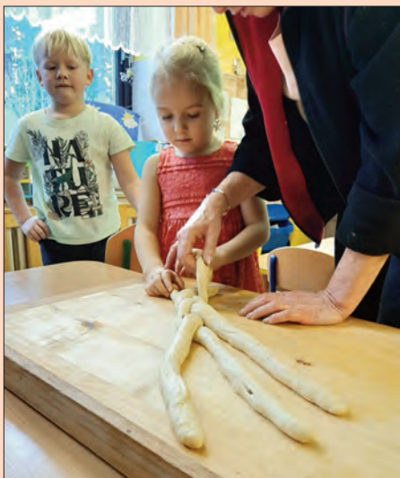
Ve vánočním čase jsme upekli perníčky a vánočku.