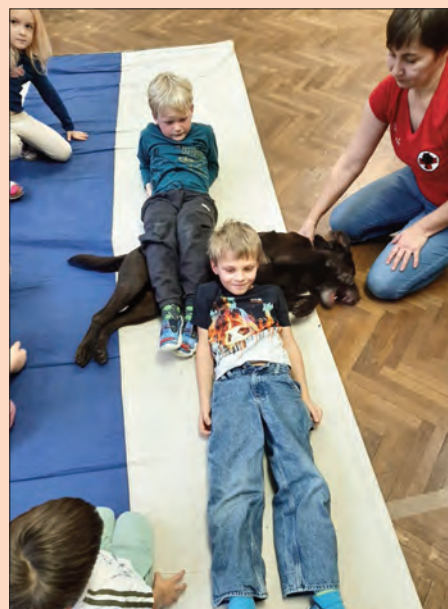
Děti si prožily canisterapii na vlastní kůži.