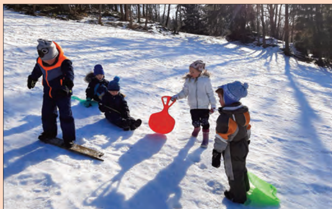
A také jsme si užili zimní radovánky.