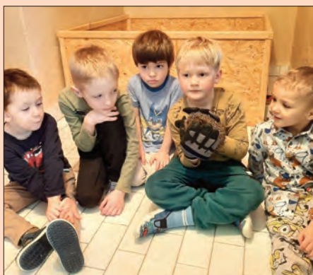
Staráme se v tomto období o ježečka.