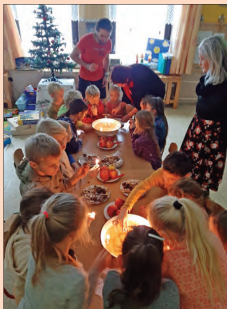
Navštívil nás Mikuláš se svoji družinou a završili jsme toto období se školáky u vánočního stolu rozkrojením jablíček a pouštěním lodiček.