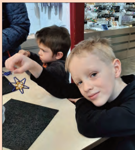
Děti si vyrobily hvězdičku v Rautisu.