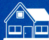
Online aplikace Katastru nemovitostí